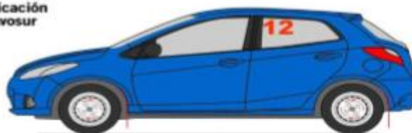
Instalación y Ubicación Números Rally Avosur